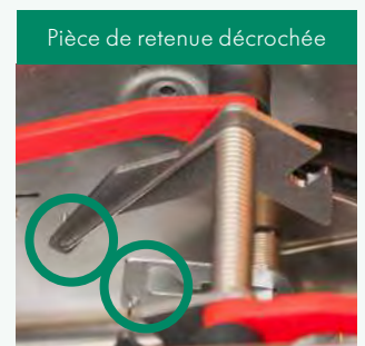
Pièce de retenue décrochée