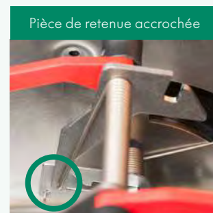
Pièce de retenue accrochée

Contrôler que les ressorts soient bien en place.